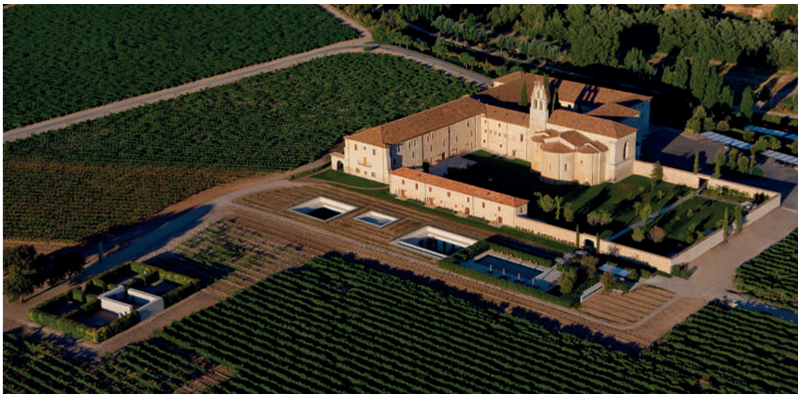
Edificio SPA, anejo a las instalaciones hoteleras en Monasterio de Santa María de Retuerta. Sardón de Duero, Valladolid. Antonio Paniagua Diener&Diener Architekten AG Office Marco Serra.

y abstracción sigue vigente en todos ellos dada la especial relación existente entre paisaje-suelo y arquitectura.