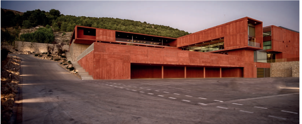
Bodega Pago de Carraovejas. Peñafiel, Valladolid. Amas4arquitectura (Fernando Zaparaín, Eduardo García, Fermín Antuña, Javier López de Uribe).

La importancia de la cultura enológica en nuestra provincia es por todos conocida. Se trata de un sector que, además de tener un impacto económico muy relevante para el territorio, ha tenido una especial sensibilidad en ámbitos culturales, sociales o paisajísticos vinculados a la arquitectura.