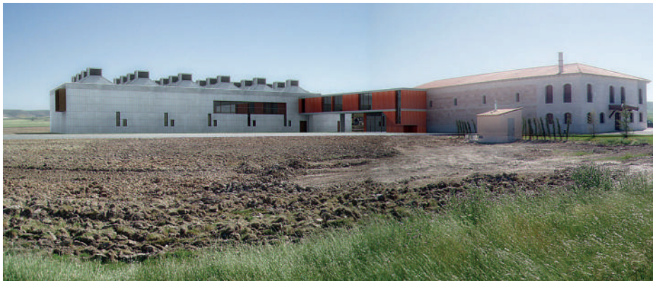
Ampliación de Bodega. Peñafiel, Valladolid. de Jose M o Jové Sandoval.

Por último y como preámbulo de la segunda parte de la sala, se muestran las arquitecturas no construidas o en proceso de construcción proyectadas por colegiados de la provincia de Valladolid. En ellas se muestra una selección documental, como un collage gráfico diverso sobre las reflexiones arquitectónicas que están aconteciendo en la arquitectura contemporánea relacionada con este sector.