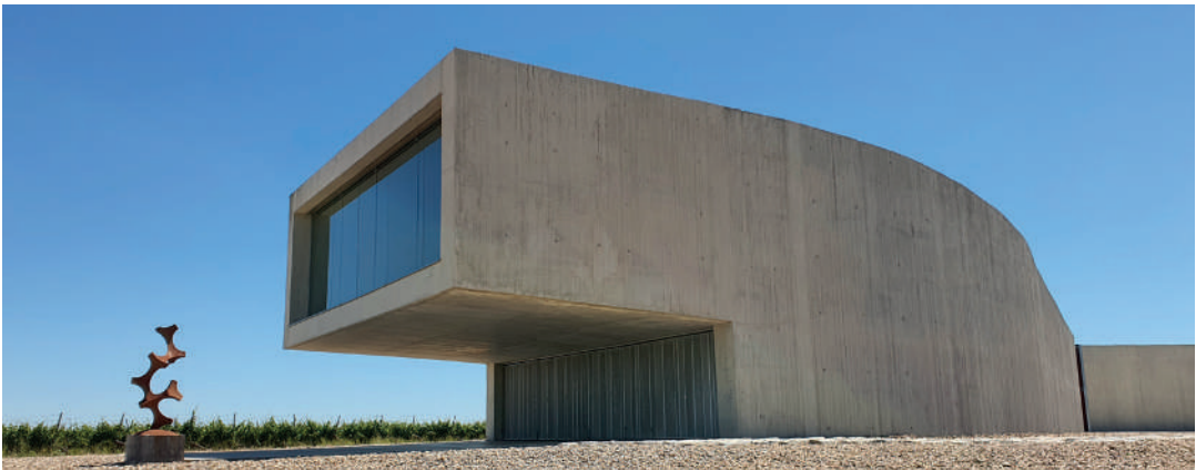
Sala de barricas en Bodega Belondrade. La Seca, Valladolid. Odimasp (Eduardo Carazo Lefort, Víctor J. Ruiz Mendez, Paloma Gil, Alberto Grijalba Bengoetxea, Julio Grijalba Bengoetxea).

Siendo una tipología especialmente ligada al ámbito rural, la exposición divulga una arquitectura que trata de ser un agente transformador de nuestra región. Es decir, mostramos aquella arquitectura que es capaz de modificar el territorio, mediante cuidados procedimientos espaciales y paisajísticos.