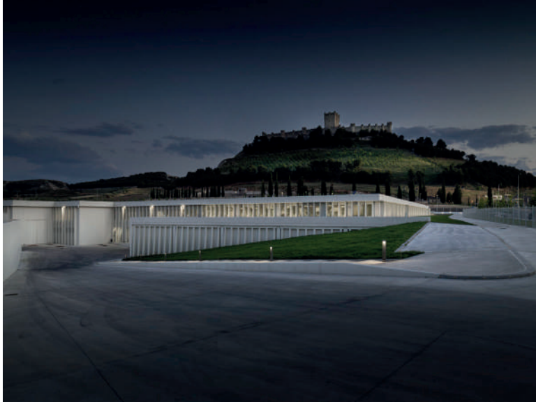
Nueva Bodega Protos. Peñafiel, Valladolid. Antonio Paniagua. Estudio de Arquitectura

Calle Jorge Guillén, 6, Valladolid. | +34 983 362 908 | www.museoph.org Martes a viernes de 11 a 14 h y de 17 a 20 h. Sábados de 11 a 20 h y domingos de 11 a 15 h