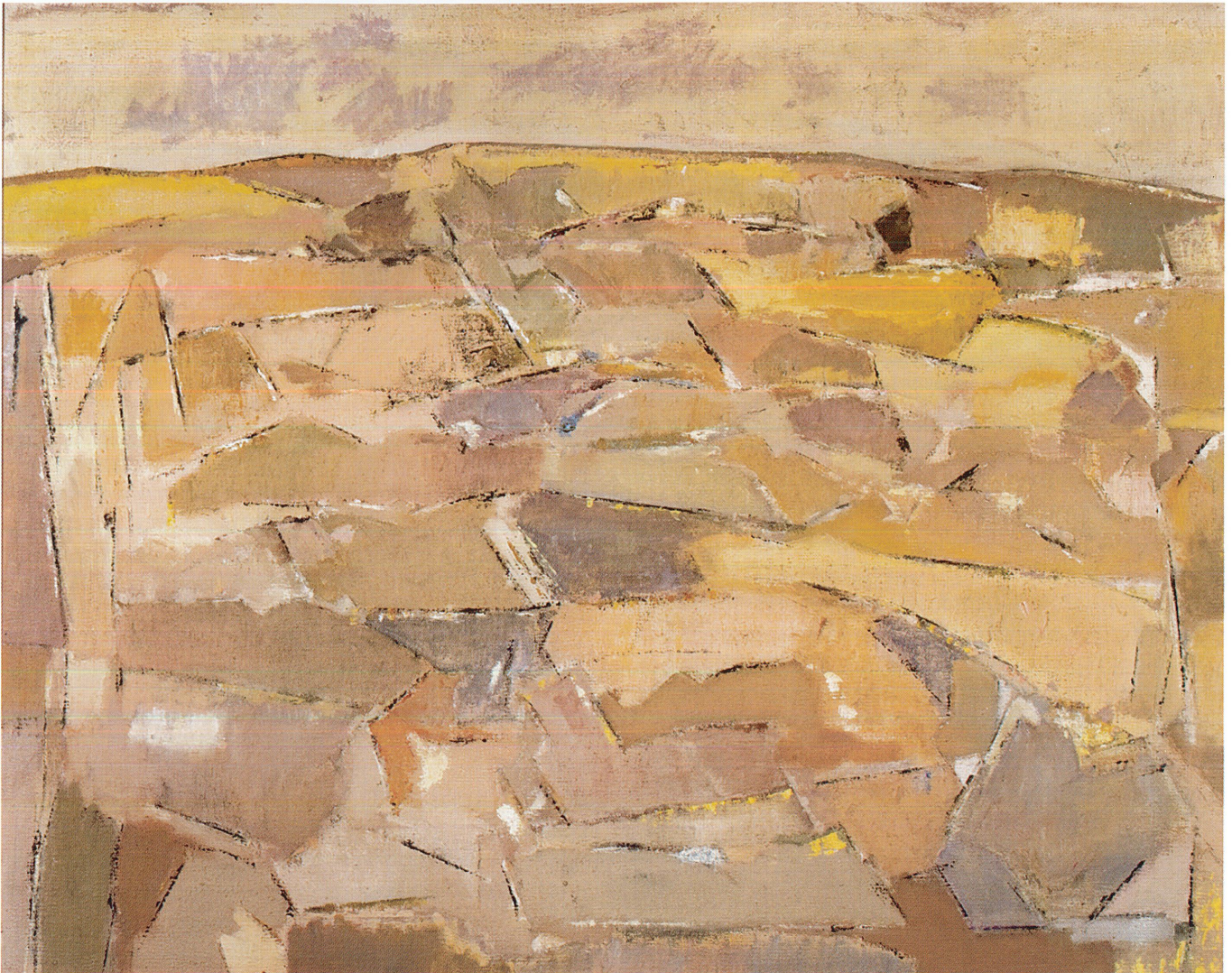
José Manuel Díaz Caneja. Paisaje , 1979. 72 x 93 cm