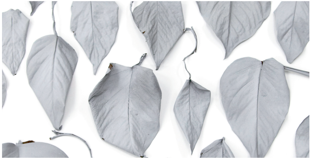
Herencia , 2016 © Marlon de Azambuja (Detalle)

En Herencia , Marlon de Azambuja (Brasil, 1978) realiza una instalación cuya razón de ser se encuentra en el núcleo de sus cuestionamientos personales sobre su propio bagaje cultural, su relación con su país de origen, así como las proyecciones que se vierten sobre su obra al asociarla con la fuerte cultura brasileña, manifiesta tanto en el campo de las artes y la arquitectura, como con la idea utópica de la modernidad.