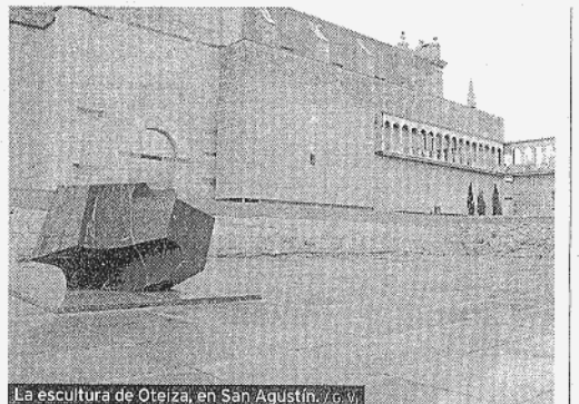
La escultura de Oteiza, en San Agustín.

tel, sede de la Diputación situada justo en frente, como en la iglesia de San Pablo y en el cercano Museo Nacional de Escultura. En la Corporación vallisoletana se buscaba, al menos desde el año 1998, otro punto de la ciudad con mejores condiciones de exposición que el situado en la calle Cadenas de San Gregorio.